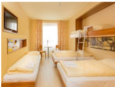
Sistemazione Hotel Vienna Centro

Prima colazione in hotel , rilascio delle camere. Ore 8:00 sistemazione in Bus Trasferimento in Aeroporto. Disbrigo delle formalità di imbarco e partenza per Roma ore 10:35 con volo Vueling. Arrivo ore 12:10 , sistemazione in Bus Riservato e trasferimento fino all'istituto (Deutsche Bank in Via G.M. Bosco). Fine dei servizi.